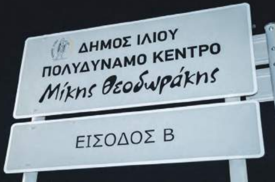
Τα αποκαλυπτήρια του ονόματος