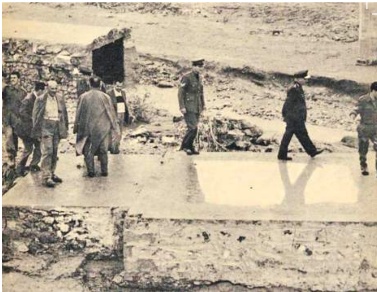
Το τσιμεντένιο δάπεδο είναι ό,τι απόμεινε από την κατοικία της οικογένειας Ρίτση

νων: «Ο Στρατός διένειμε περί τους 9.000 άρτους. Και οι υπηρεσίες του υπουργείου Προνοίας διένειμαν δέματα με τρόφιμα και ρουχισμόν (...) Βάρκες στις λιμνοθάλασσες των συνοικιών. Στο Μοσχάτο, τα Καμίνια και το Περιστερί, οι κάτοικοι έκαναν ευρύτατη χρήση λέμβων»