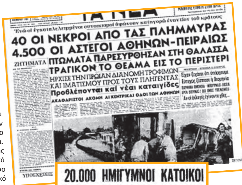
«ΤΑ ΝΕΑ», 6.11.1961

Συγκλονιστικά είναι τα δημοσιεύματα και οι φωτογραφίες από τον Τύπο των ημερών εκεί-