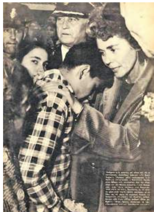
Η Φρειδερίκη παρηγορεί νεαρό πλημμυροπαθή